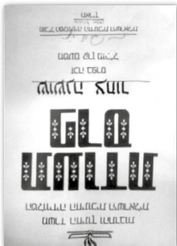
Ocenění za pořad pro děti „Parpar Nechmad“ (O roztomilém motýlku).

Změna, ke které se rozhodla, prospěla bezesporu všem zúčastněným. Bez ní by izraelské děti neměly možnost sledovat slavný pořad „Parpar Nechmad“, neboli „O roztomilém motýlku“, také „Pistáciový dům“, „Chvilku s Dudele“ a řadu dalších. Přestože byly pořady vysílány na vzdělávacím kanále, z „Roztomilého motýlka“ se stal největší trhák tehdejšího izraelského televizního vysílání pro děti a dnes představuje televizní klasiku.