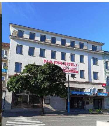
Současná podoba budovy hotelu Bristol