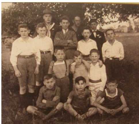
Břeclavský oddíl Hašomer Hacair, 1925

Hnutí Hašomer Kadima na Slovensku zápasilo o existenci a postupně podléhalo tlaku agresivnějšího a více sionisticky zaměřeného Hašomer Hacair (Mladý strážce). Ohlas tohoto zápasu se v Břeclavi projevil tak, že zdejší uskupení Hašomer Kadima postupně přešlo na pozici Hašomer Hacair a pokračovalo dál v činnosti.