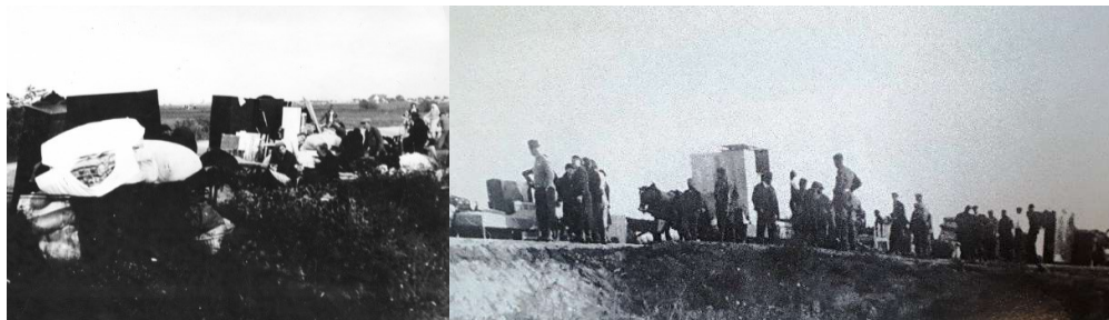
Břeclavští občané židovského původu vyhnání do tzv. Niemandslantu