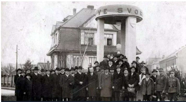
Památník Svornosti na Smetanově nábřeží v Břeclavi, jehož odhalení se v roce 1934 zúčastnili také židovští skauti z oddílu Makabi Hacair.