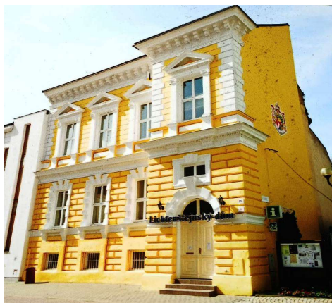
Bývalá židovská škola, dnes Lichtenštejnský dům; v nízkém podlaží této budovy měli ve 20. letech minulého století klubovnu židovští skauti