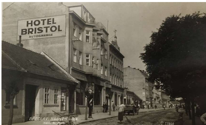
Hotel Bristol v Břeclavi, 1929