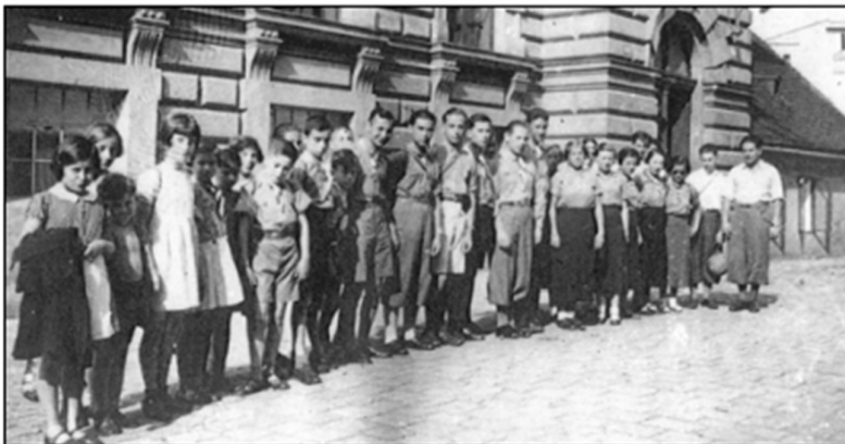
Oddíl Makabi Hacair v roce 1933 před židovskou školou, ve které byla klubovní místnost [reprint ze Zpravodaje města Břeclavi, květen 2010Rad 05 10.indd (breclav.eu)]