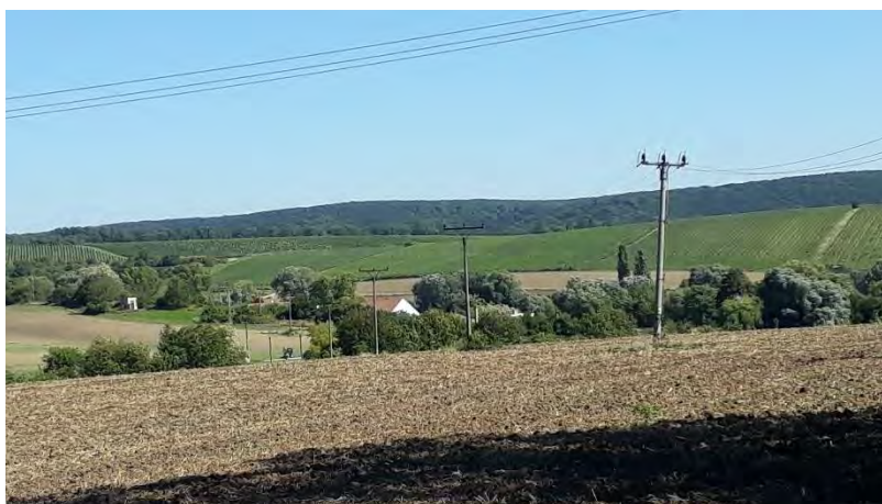
Místo zvané „U hrobu“

Ani v tomto případě nejde o příběh místních židovských usedlíků, nýbrž o tragický děj se strašlivým koncem, který sestal ve vypjaté době na konci války, kdy už se k jižní Moravě blížila ruská fronta. V areálu cihelny pracovalo jednadvacet Židů zavlčených sem pravděpodobně z Maďarska, údajně šlo o tři rodiny deportované ze Szegedu; obývali část nazývanou „Judenlager“, nikdo o nich nic nevěděl, a také proto byla velmi ztížená následná identifikace. V polovině dubna byli vyzváni, aby v poli vykopali příkop – a v noci k němu byli zavlčeni a pobiti.