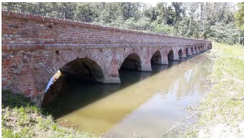
Most ze sedmnáctého století

Já jsem se do množiny „málokdo“ prostě nevešla: nebyla jsem ani pohraničnick, ani osoba prověřená. Moje rodná vesnice se totiž jmenuje Sedlec u Mikulova a nachází se jen pár set metrů od hranic s Rakouskem.