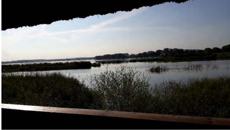
Rybník Nesyt časně ráno z ornitologické pozorovatelny