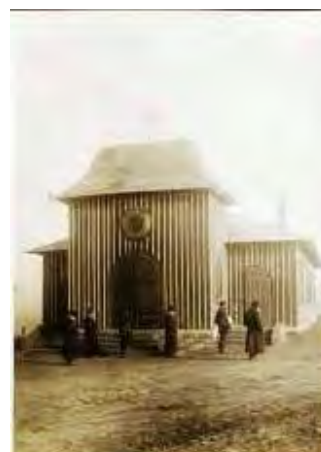
Provizorní synagoga