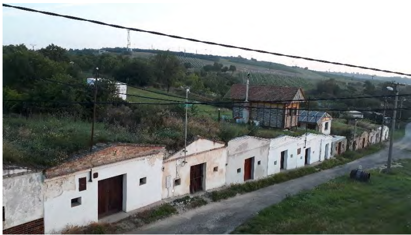
Kolonie sklepů v Sedleci