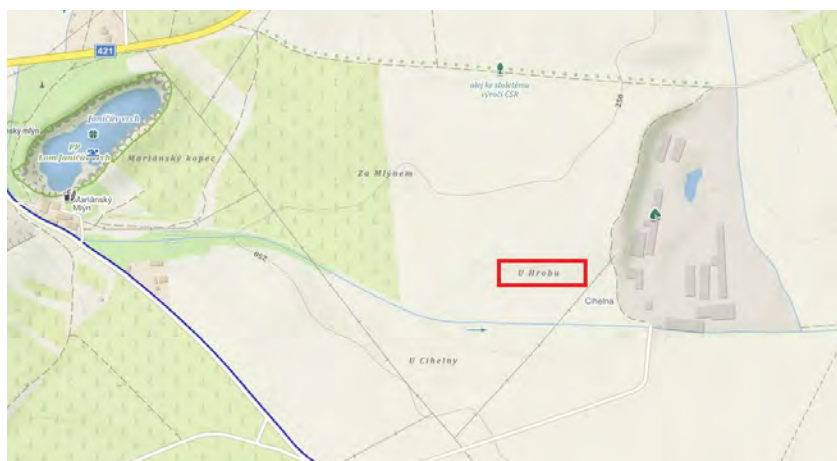
Místo zvané „U hrobu“