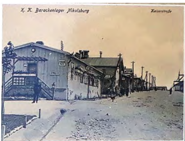
Ulice na Mušlově, 1917

Na informační tabuli se dočteme, že pomoc haličským Židům tehdy organizoval majitel zdejšího panství kníže Hugo Dietrichstein ve spolupráci s mikulovskou židovskou obcí, a protože tímto táborem prošlo na čtyři tisíce židovských uprchlíků, fungovala zde synagoga a také škola.