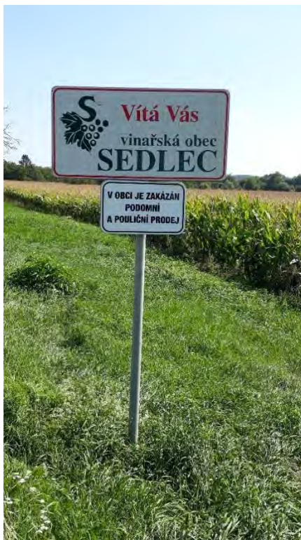
Sedlec, vinařská obec

Přiznávám, že „doma“ jsem vlastně trávila dovolenou poprvé. Ne že bych rodný kraj úplně zanedbávala, to v žádném případě, ale obvykle se moje návštěvy odehrávaly v rámci rodinných setkání či srazů anebo kvůli událostem smutnějšího rázu – kvůli pohřbům rodinných příslušníků. A teď – slovy Bohumila Hrabala – se neuvěřitelné stalo skutkem a já jsem vyrazila domů.