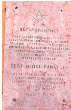
Pamětní tabule na mikulovském náměstí s neúplnými údaji