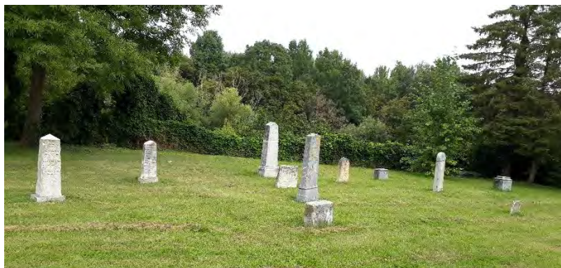
Celkový pohled na znovuobnovený židovský hřbitov v Lednici

Další výprava vedla do míst, kde jsem zájem místních kvitovala s povděkem: vyrazila jsem hledat obnovený židovský hřbitov v Lednici.