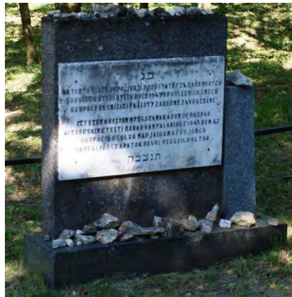
Náhrobek na společném hrobu maďarských Židů

V Mikulově na hlavním náměstí je pamětní deska s textem, který zavražděné připomíná, ovšem s dobovým textem, který nezmiňuje to hlavní – totiž že šlo o Židy. A také hvězda je zavádějící – nejde o židovskou Magen David, byť je podobně stylizovaná. Oběti mají malý náhrobek na mikulovském židovském hřbitově, kam byly po exhumaci v pětáctýřicátém roce převezeny. Autor Vojtěch Kyncl píše v knize „Bestie – Československo a stíhání nacistických zločinců“ o tom, že vraždu těchto židovských občanů nelze označit jinak než jako projev sadismu nacistů, protože podvyživené a vysílené oběti pro Němce žádné nebezpečí nepředstavovaly.