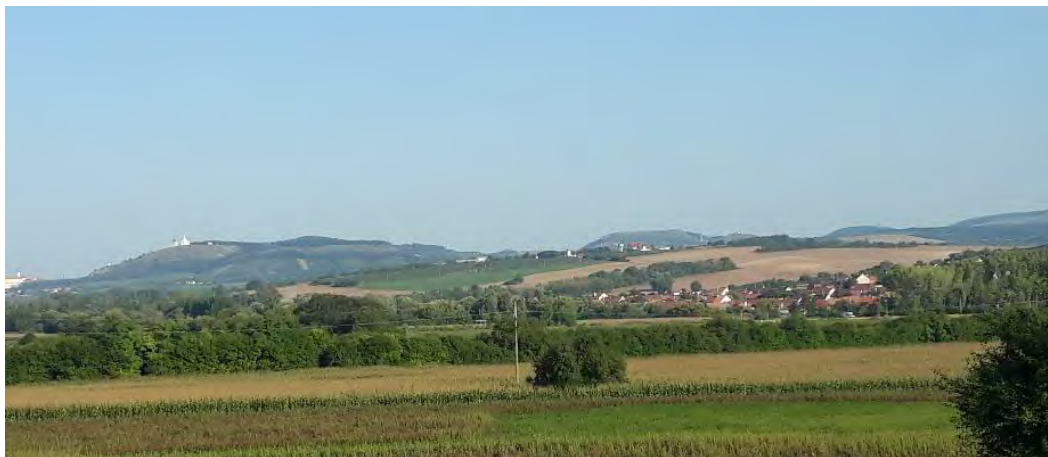
Pálava s Mušlovem

A tak jsem si aspoň prohlédla opravený a upravený areál, bylo vidět, že staronový majitel místu věnuje patřičnou péči. Po roce 1989 byl totiž statek v restituci vrácen potomkům původních vlastníků a mohlo se začít s revitalizací celého prostoru. Po důkladné rekonstrukci dnes dvůr slouží jako ekofarma, a také se zde kromě původního zemědělského zaměření pořádají různé zajímavé kulturní akce. Tolik tedy k Haidhofu, Ovčárně, „dvoru na mokřině“, jak se mu říkávalo, kterému genia loci původně vtiskli novokřtění a který má ve vlídné krajině místo dodnes.