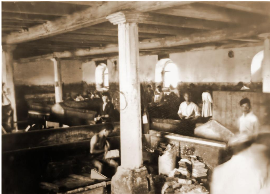
Práce v dílnách

Důležité rozhodnutí padlo na tzv. Vůdcovských dnech, na celostátní konferenci svolané do krušnohorské Moldavy, kam se na Chanuku, tedy v termínu 24.–26. prosince 1922 sjeli vedoucí všech českých gduim Tchelet Lavan 3 . Jednání se výrazně lišilo od všech předchozích, protože jednak byl určen stabilnější organizační model na národní i regionální úrovni, dále byl přednesen projev, který se stal ústředním bodem všech aktivit hnutí v příštích měsících a létech a pro nás skauty měla tato konference ještě jeden důležitý aspekt – s trochou nadsázky by se dalo říci, že od tohoto data vede s velkou pravděpodobností přímá linka ke vstupu Tchelet Lavan do Federace československých skautů v roce 1924.