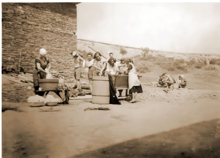
Praní prádla a pomocná služba v kuchyni

Místo poskytla k užívání rodina Abelesových, kterým rovněž patřila velká zemědělská usedlost v nedalekých Podbořanech. Do Göhly tedy vyrazila jakási technická četa sestávající z pěti lidí, aby provedla potřebné přípravy, protože podmínky tam byly velmi primitivní: