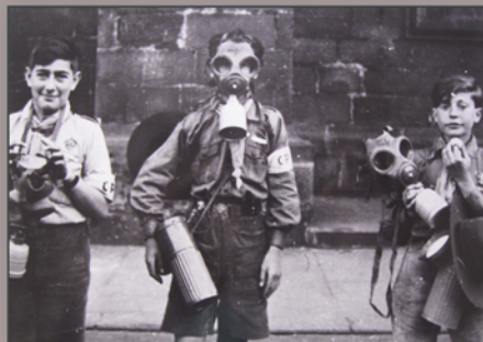
Židovští skauti při cvičení Civilní protiletecké ochrany na Náměstí Republiky v Plzni, 1938