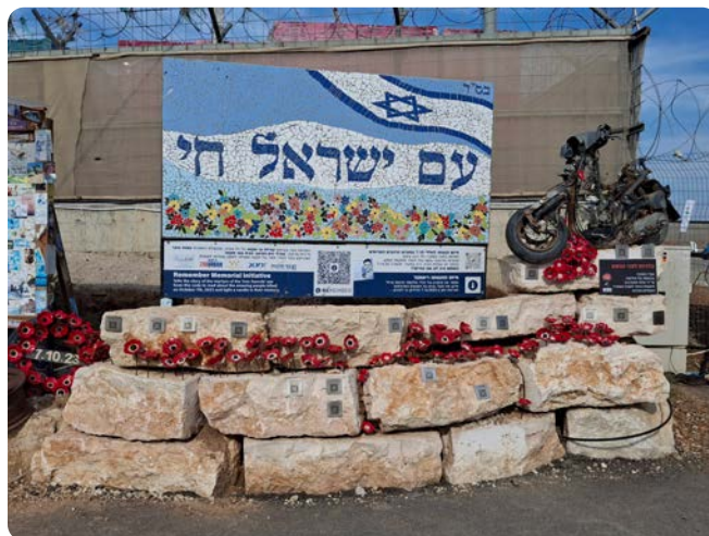
Památník „Zeď aut“ v Tkumě

Slovy se to těžko popisuje; bylo to, jako by člověk skočil „placáka“ a místo na vodu narazil na skálu. Obrovský otřes. Izraelci tady shromáždili zbytky spálených a rozstřílených aut a motocyklů zlikvidovaných v celé oblasti během říjnového útoku.