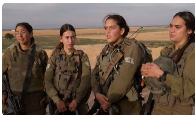
Dívky z tanku

Průzkumná jednotka Caracal operuje podél hranice s Egyptem ze základny tankového vojska Nitzana a slouží v ní jenom ženy. Ráno 7. října 2023