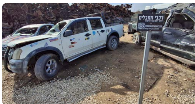
Bílá Toyota – oblíbené auto palestinských teroristů