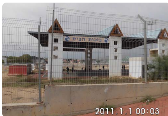
Dětské hřiště s protiraketovým krytem