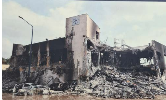
Policejní stanice ve Sderotu před a po útoku 23. 7. 2023