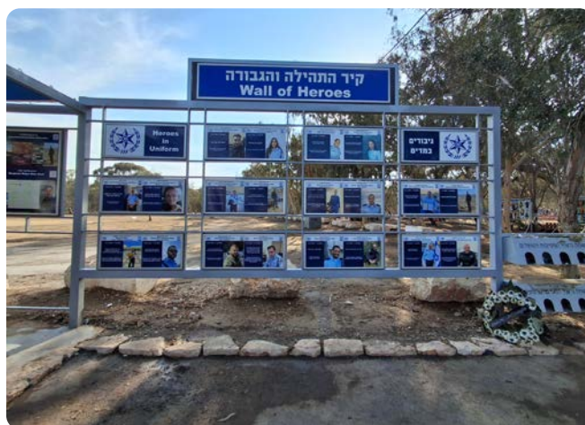
Zed' hrdinů – policistů, kteří padli při boji s útočníky