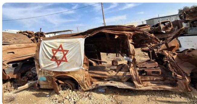
Jak vymytý mozek musí mít člověk, který zaútočí na sanitku?

A znovu říkám: jestli se i po této apokalypse najde někdo, kdo je schopen prosazovat dvoustátní řešení, kdo je schopen obhajovat spolupráci s palestinskými Araby, kdo je schopen připnout si na tričko palestinskou vlajku případně se zabalit na znamení sympatií do kefije, toho je nutné poslat nejprve do