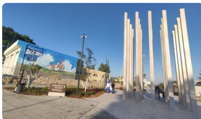
Na místě policejní stanice nyní stojí Památník a park hrdinů.