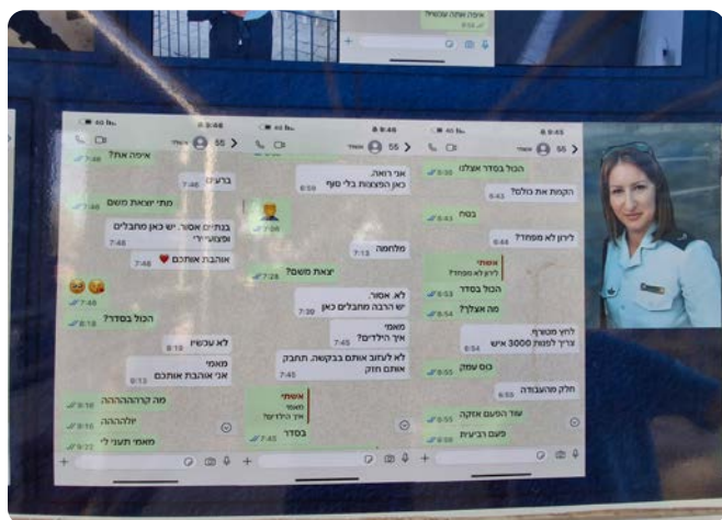
Poslední textové zprávy