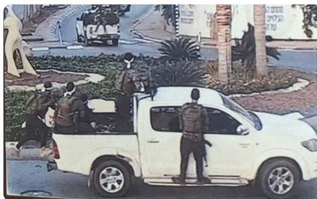
Cíle muslimských teroristů se nenacházejí pouze v Izraeli