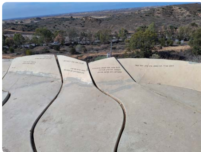
Památník Čtyř na vrcholu Jakubova kopce (Givat Kobi). V roce 2014 zde zahynuli čtyři izraelští vojáci při obraně Sderotu v boji proti teroristům, kteří se kousek odtud vynořili z podzemního tunelu