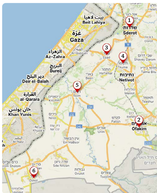
Zastávky na cestě: 1 – Sderot, 2 – Ofakim, 3 – Sa'ad, 4 – Tkuma, 5 – Re'im, 6 – Dekel

Jsou v Izraeli místa, která do 7. října roku 2023 znal málokdo – i mezi těmi, pro které je tato blízkovýchodní země srdeční záležitostí. Uplynuly sotva dva roky a na jedinou vsichni víme, kde na mapě hledat město Sderot, kde se nachází Re'im, místo hudebního festivalu Nova, případně co si představit pod pojmem Tkuma. Takže když mi izraelská přítelkyně Yael nabídla, že mně do těchto míst doprovodí, nerozmýšlela jsem se ani chvíli, ačkoli bylo od začátku jasné, že výprava to bude po všech stránkách náročná.