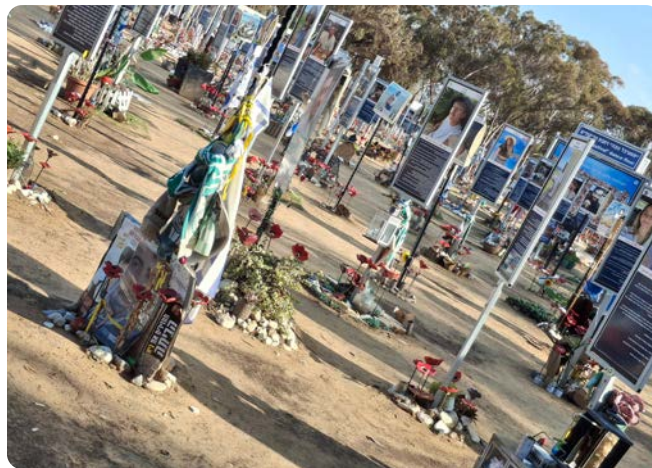
Les památníků zavražděných účastníků festivalu. Červené sasanky kvetou v zimě v nedalekém lese Re'im, v památníku symbolizují ztracené mladé životy.

zlikvidování mezi prvními. Vybrat si pro pořádání jakéhokoliv festivalu otevřené místo poblíž hranice s pásmem Gazy nepovažuju za rozumné v žádném směru. Snad to budou mít na paměti všichni pořadatelé jakýchkoliv akcí v této oblasti.