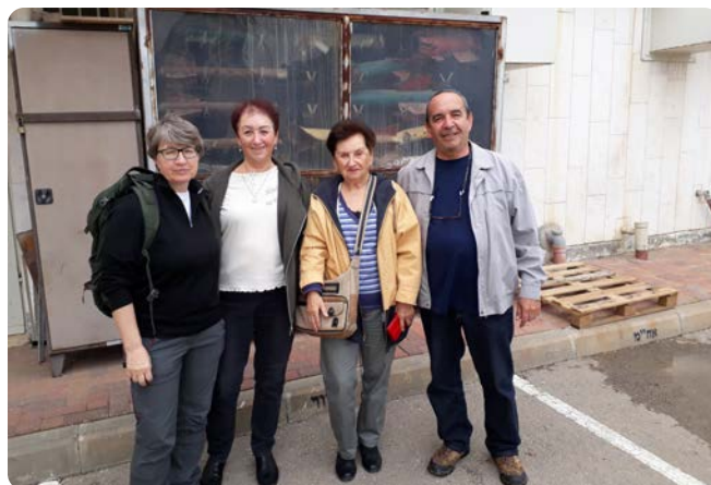
Ve skříni v pozadí jsou zbytky raket, které v roce 2018 dopadly do Sderotu.

Velící policista uděluje příkaz zraněnému kolegovi: „Postarej se o ty děti, já zůstanu tady!“