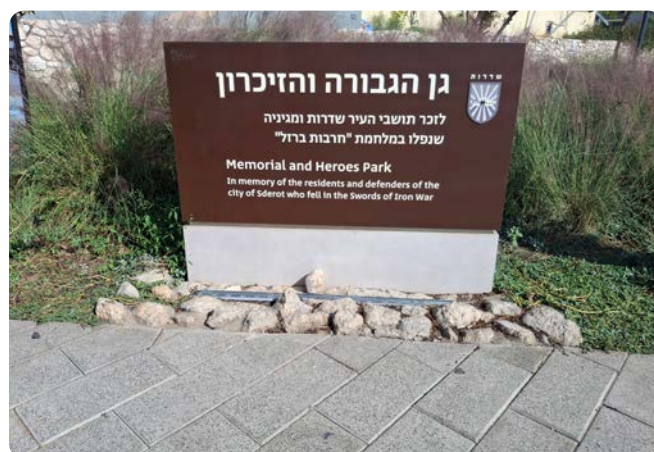
Památník v Sderotu věnovaný obětem a hrdinům

Když jsme přijely na místo, uvědomila jsem si, že jsem zde už kdysi dávno byla. Po celonočním bombardování města jsme tady tehdy viděli zbytky raket, které dopadaly na Sderot a policisté měli za úkol tyto zbytky dohledat a evidovat. V okolí jsme