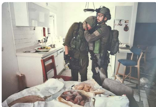
Osiřelý stůl prostřený k oslavě a zdrčení vojáci