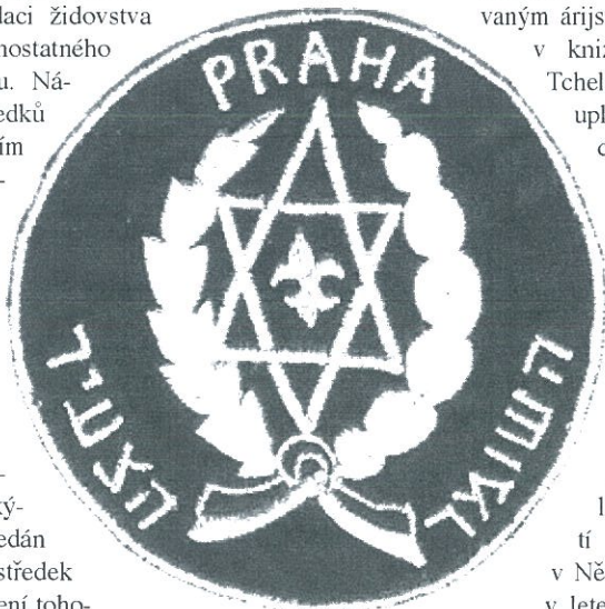
Nášivka pražského Hašomer Hacair (ze sbírky Miroslava Hopfingera-Jističe)

vznik první židovské organizace skautského typu v tehdejší Rakousku-Uhersku v roce 1913. Židovská obdoba německého Tažného