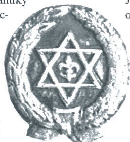
Skautská lilie uprostřed Davidovy hvězdy – to byl odznak Tchelet Lavan, první židovské skautské organizace v našich zemích

Hnutím celostátního rozsahu bylo Makabi Hacair (Mladý Makabejec). Někteří ►