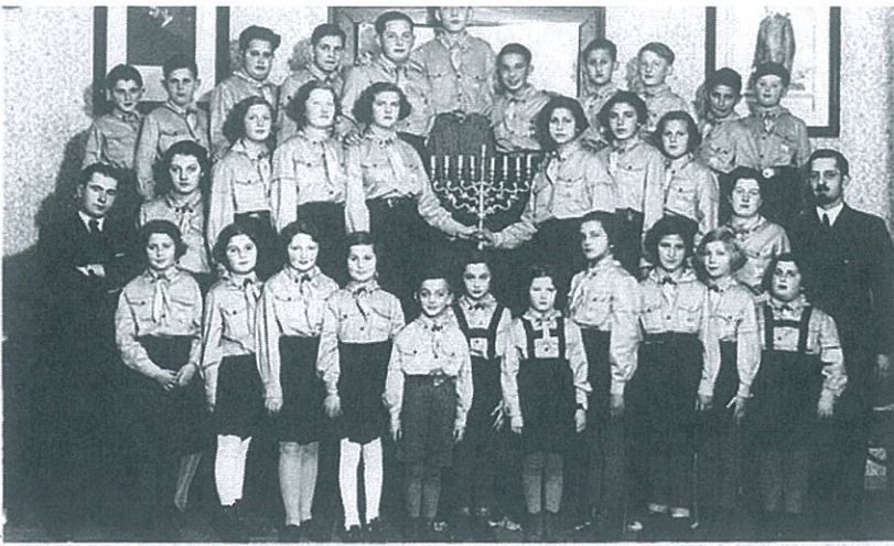
Oddíl Makkabi Hacair v Holešově slaví chanuku – rok 1935 nebo 1936

► autoři udávají, že toto hnutí působilo na Slovensku údajně od roku 1920 (viz např. diplomová práce Michala Milly: „História skautského hnutia na Slovensku s prihliadnutím na jeho vznik, vývoj a pôsobenie vo svete a v Československu“). Naproti tomu Zwi Batscha uvádí, že Makkabi Hacair jako mládežnické hnutí tělocvičného spolku Makkabi vzniklo teprve roku 1926 současně v Čechách, na Moravě i na Slovensku.